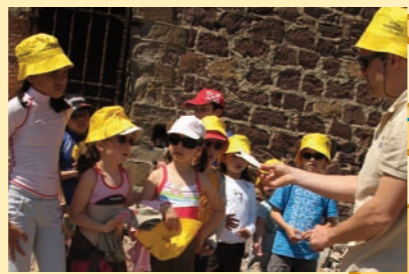
Rando Nature, les enfants découvrent les laisses de mer : débris et déchets organiques.