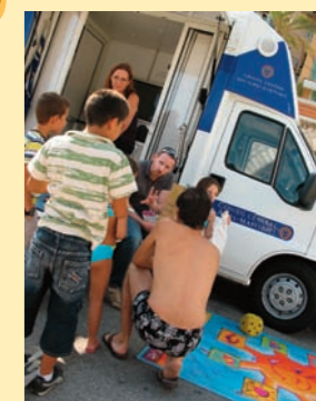
Le Bus info santé répond à toutes vos questions.