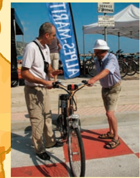
Le prêt de vélos électriques.