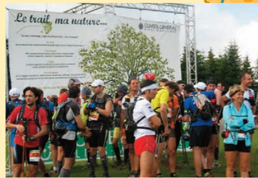
La bache « l'Arbre de ma Nature » signée par tous les traileurs